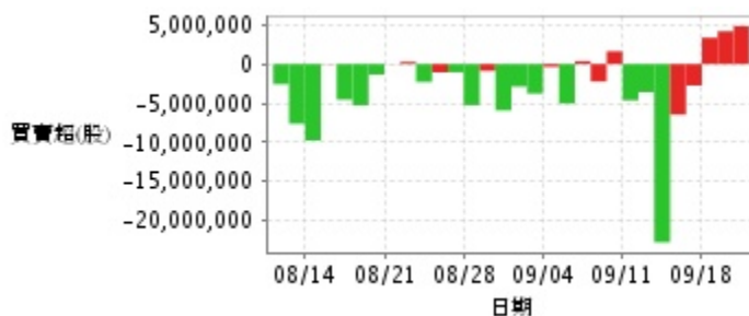
外資及陸資買賣超