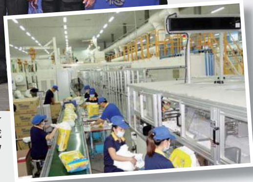
嬰兒拉拉褲生產線。

(左起)理律法律事務所宋天祥律師、勤業眾信聯合會計師事務所龔雙雄會計師、兆豐證券股份有限公司簡鴻文董事長、泰昇國際(控股)有限公司戴朝榮董事長、證交所李啓賢總經理、證交所簡立忠副總經理及證交所黃乃寬副總經理一起合影慶祝泰昇-KY上市掛牌成功。