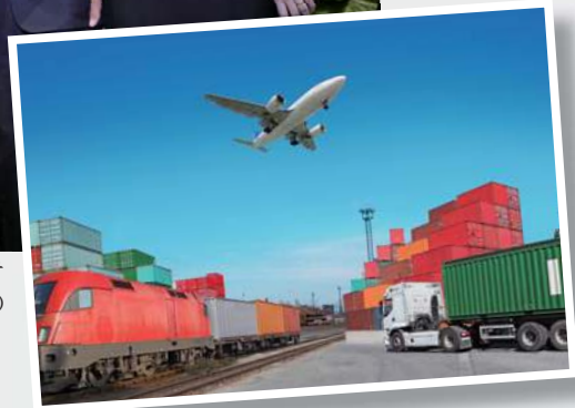
台驊專事陸、海、空運輸承攬服務及物流服務。

台驊成立於1987年，是一家經營海空貨運代理、物流倉儲業務的專業物流公司，在東南亞、大陸等有70個據點及400家海外代理商業務資源，計畫5年內將全球據點擴增到100個，在全球擁有超過2,000名員工。