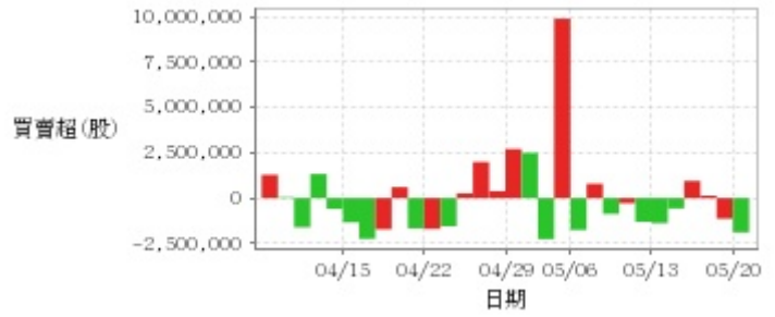
外資及陸資買賣超