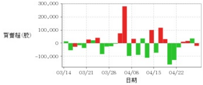
外資及陸資買賣超