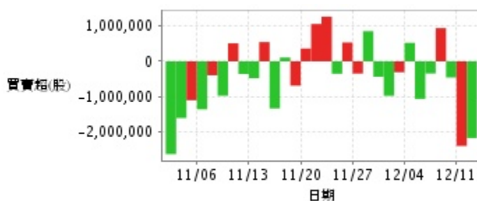
外資及陸資買賣超