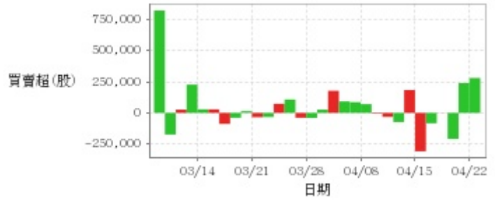
外資及陸資買賣超