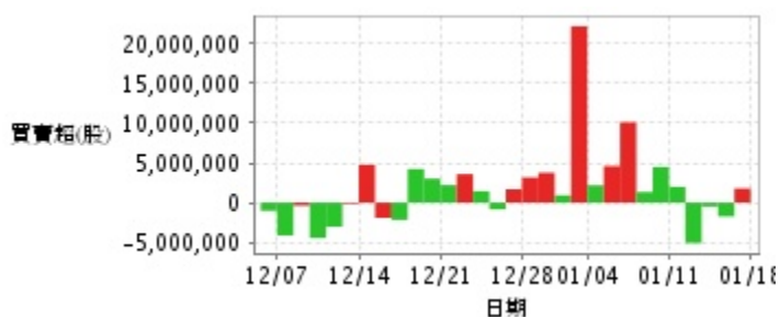
外資及陸資買賣超