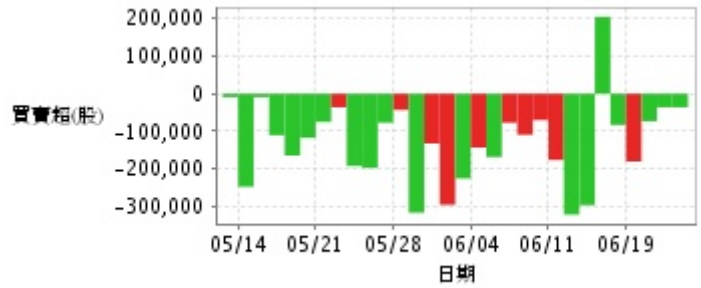
外資及陸資買賣超