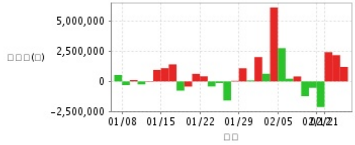
外資及陸資買賣超