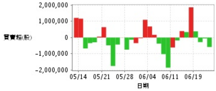
外資及陸資買賣超