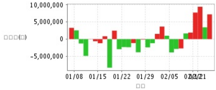
外資及陸資買賣超