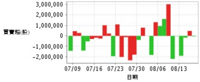
外資及陸資買賣超