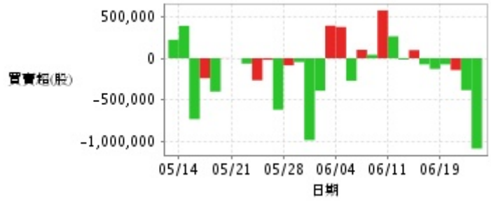
外資及陸資買賣超