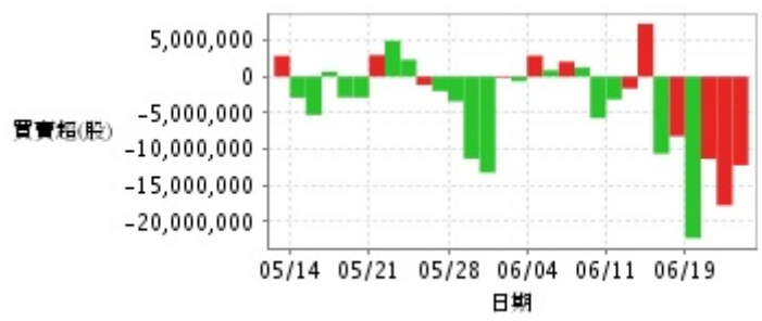
外資及陸資買賣超