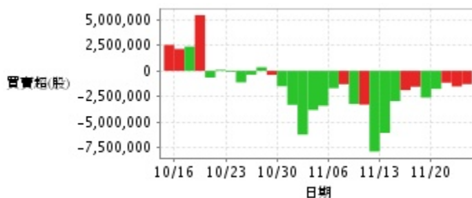
外資及陸資買賣超