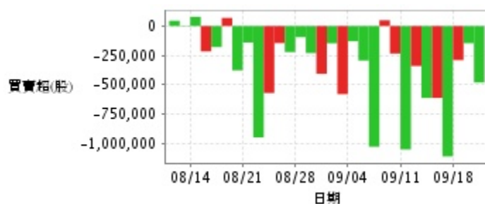
外資及陸資買賣超