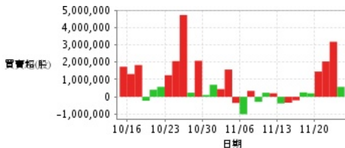
外資及陸資買賣超