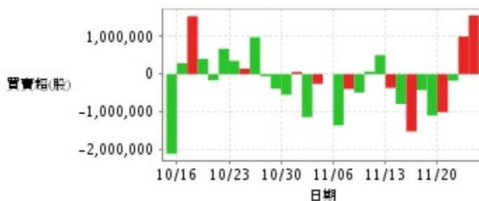
外資及陸資買賣超