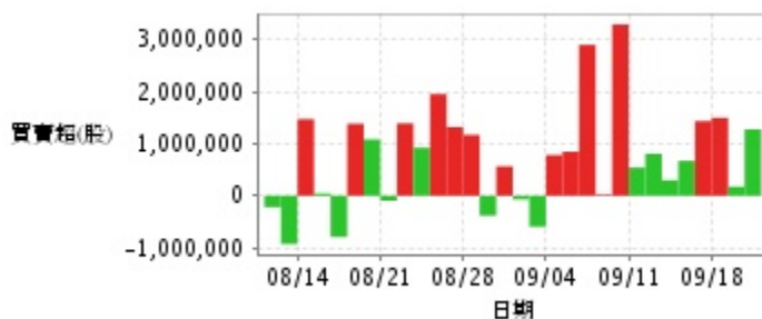
外資及陸資買賣超