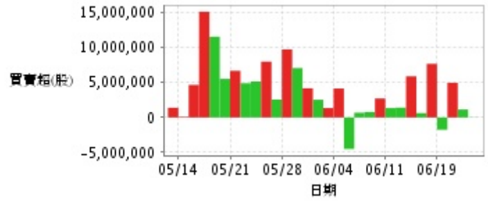
外資及陸資買賣超