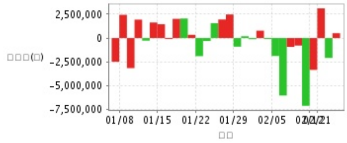
外資及陸資買賣超