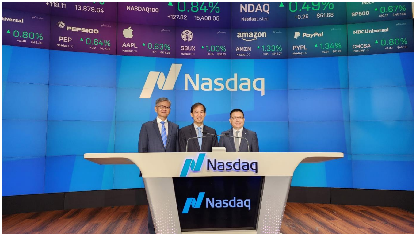
我國駐紐約辦事處李光章大使、證期局張振山局長及證交所林修銘董事長等一行於拜會納斯達克交易所及獲邀請觀賞開盤敲鐘儀式後合影。