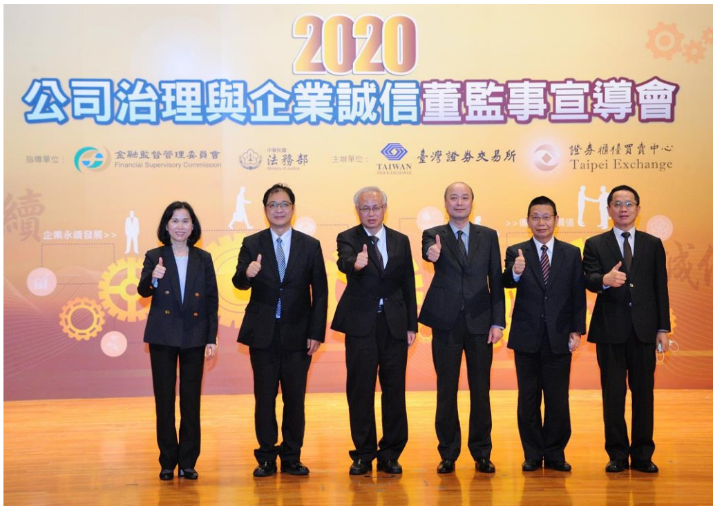
圖說：法務部張斗輝常務次長(左三)及金融監督管理委員會許永欽副主委(右三)與講者及主辦單位首長合影

臺灣證券交易所與櫃買中心分別於 10 月 16 日及 10 月 22 日假台北及新竹辦理「2020 年公司治理與企業誠信董監事」，邀請上市櫃公司董事、監察人及公司治理主管參加，分享私部門反貪腐、投保法最新修正要點及董監事責任與永續發展藍圖，兩場次參與人數逾 700 位，彰顯上市櫃公司對於公司治理與企業誠信的重視程度。