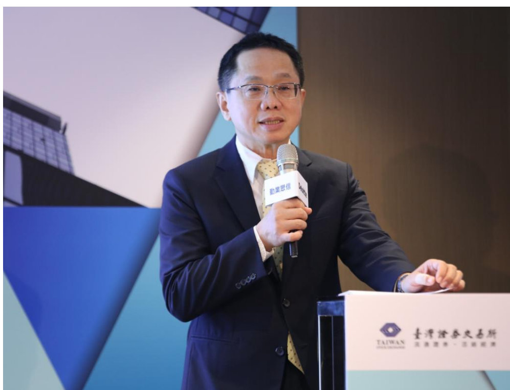
圖二：主辦單位證交所簡立忠總經理於活動開場致詞。

臺灣證券交易所總經理簡立忠於會中表示：「依據世界交易所聯合會(WFE)2019年之統計數據，臺灣資本市場全體上市公司市值逾一兆美元，市值排名全球第18位，成交值則排名第12位」。臺灣資本市場除市場活絡程度高之外，在法規透明度、審查時程掌握、國際化程度及二次籌資(SPO)便捷等面向均具優勢，相對適合臺商企業回臺上市，目前第一上市公司在臺掛牌家數為78家，平均本益比達23倍，上市後表現佳，倍受投資人青睞。