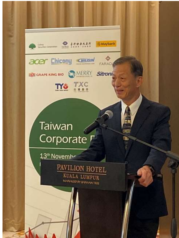
圖二：臺灣證券交易所單高年經理於午餐演講致詞

時，證交所與當地機構投資人舉行多場會談，深入了解外資需求，盼能增加投資臺股的金額。