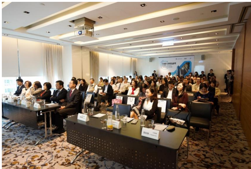
圖三：本次論壇現場實況，吸引近百家企業代表出席。

簡總經理並補充：「為吸引企業上市，證交所亦持續配合主管機關推動多項措施，致力打造更彈性的籌資環境，包括去年將審查期間縮短四分之一至六週，並設計多元上市制度，開放大型無獲利企業申請上市；本年度則開放募資規模 20 億元以上的 IPO 案件，可引進基石投資人增強市場信心，搭配海內外招商活動說明臺灣資本市場優勢及上市好處等，諸多舉措均有助吸引潛力企業來臺上市。」