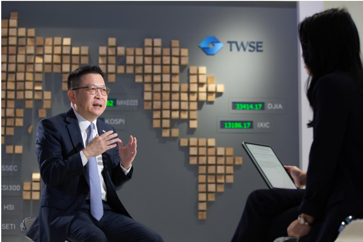
臺灣證券交易所林修銘董事長接受CNBC專訪，暢談未來證交所的發展策略與未來願景。