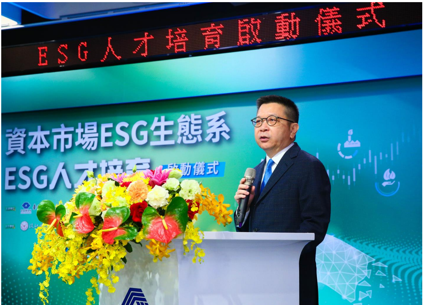
臺灣證券交易所林修銘董事長於12月20日「資本市場ESG生態系-ESG人才培育啟動儀式」致詞