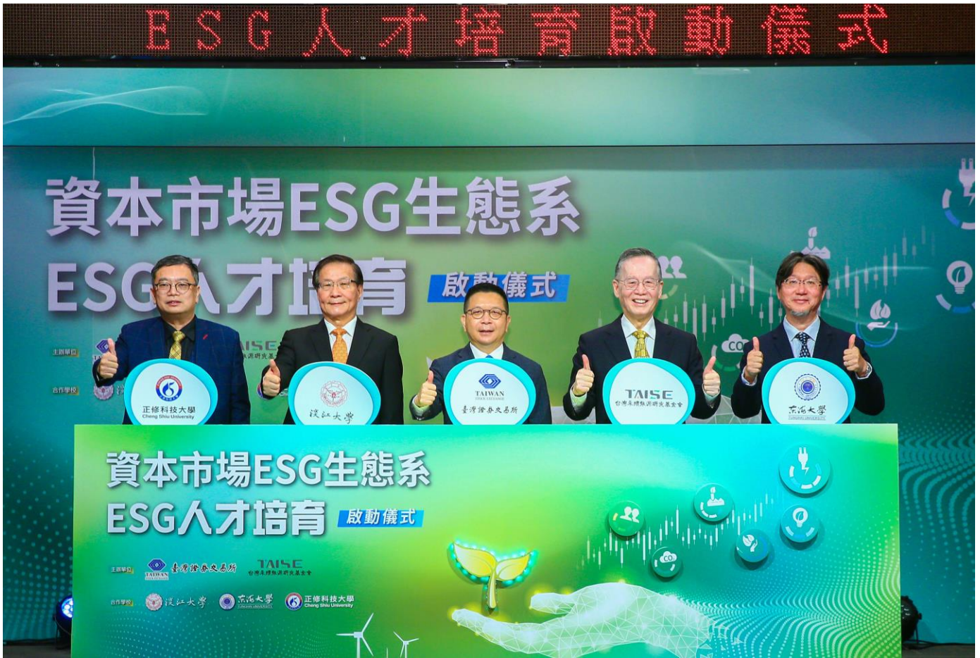
左起正修科技大學鄭舜仁副校長、淡江大學葛煥昭校長、臺灣證券交易所林修銘董事長、財團法人台灣永續能源研究基金會董事長簡又新大使、東海大學張嘉修副校長