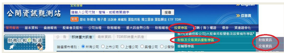
〈圖一〉分設「財務資訊」及「交易資訊」

「財務及交易資訊重點專區」僅將財務及交易資訊作一重點彙整，以便利使用者查詢參考，並藉以達到提醒投資人注意之效果，強化預警功能。投資人進行投資前仍應詳閱各該公司公開資訊觀測站相關財務業務資訊。