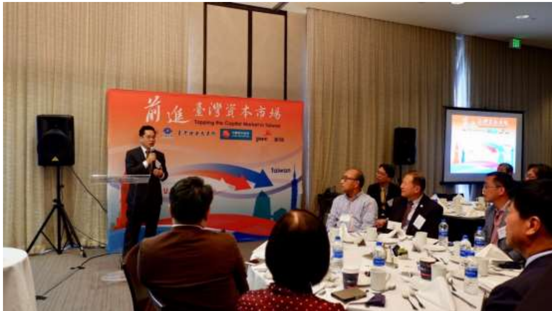
圖三：於美國矽谷舉辦之「前進臺灣資本市場說明會」現場實況，吸引約 60 家當地家臺商企業參加。

本次拜訪企業產業類別多元，橫跨生技醫療、IC 設計、電子製造、民生消費品、飯店業、餐飲業及資訊軟體等產業，均為相當優質且具競爭力的美國公司。雖然美國當地的紐約證交所及那斯達克交易所在世界交易所聯合會的市值排名分別為第 1 及第 2，惟該二市場較適合大型企業上市，市值太小的中小型企業掛牌後能見度較低，而截至目前為止，臺灣證券交易所之市值排名為 17，相對適合美國中、小型企業上市籌資，尤其臺商人親、土親，回臺上市不僅可以壯大臺灣資本市場，亦可協助企業永續成長。